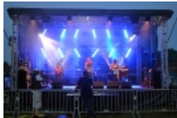
20.06.2012 II Złoty