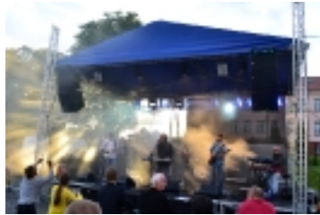
22.07.2012 Kołose Chocień