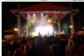
Dni Górnicy 2012 _ _ _ _