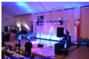
Wygrasze _ _ _ _