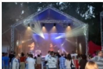
25.08.2012 Piknik Pod Tężniami -- -- --