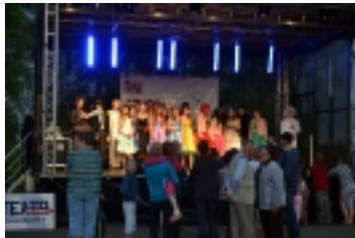
05.05.2012 Majówka w Szubinie - - - -