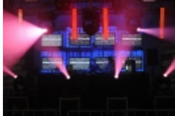
10.12.2012 Jubileusz 100-lecia 1918 - - - -