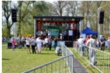
10.04.2012 Piknik w Białym - - - -