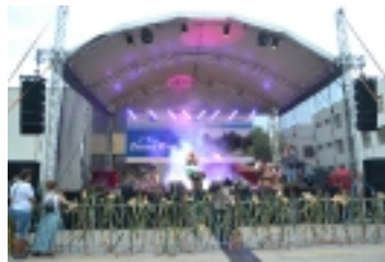
02.09.2012 Dożynki Brześć Kuj. -- -- --