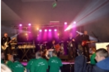
28.10.2012 Koncertów Żuków Poznań -- -- --