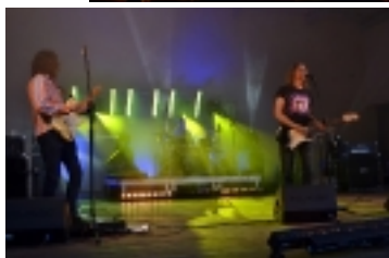
Leśny Festiwal w Mogilnie _ _ _ _