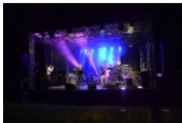
26.08.2012 Dożynki Gminne Mogilno -- -- --