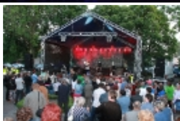
Dzień Młodych w Brześć Kuj. _ _ _ _