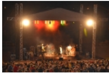
02.05.2012 Majówka w Majówce - - - -