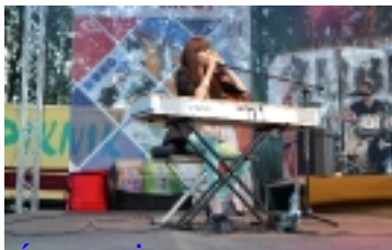
Święto Złoty Kujawskiego _ _ _ _