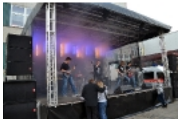
04.06.2012 Marsz w Golub-Dobrzyń - - - -