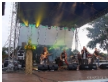
02.09.2012 Dożynki Wojewódzkie Kruszwica -- -- --