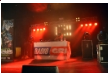
Koncert URALesko _ _ _ _