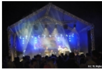
21.07.2012 Niebuzowa Kujawach