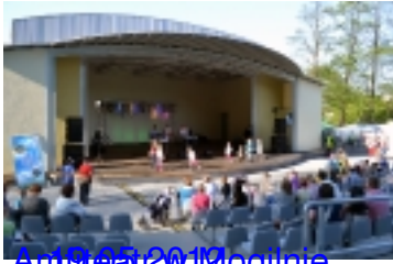
15.05.2012 Amfiteatr w Zoglinie - - - -