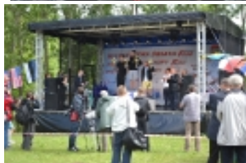
Water Festival w Panikowo _ _ _ _