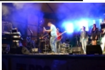
Jubileusz 100 lat Kuszyn 2012 _ _ _ _