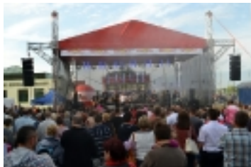
Otwarcie Galerii Osielsko _ _ _ _